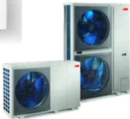
pl.: Belaria® fit hőszivattyú