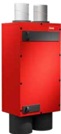
HomeVent® comfort ER