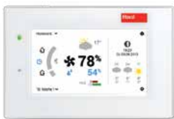
Érintőképernyős TopTronic® E beltéri egység